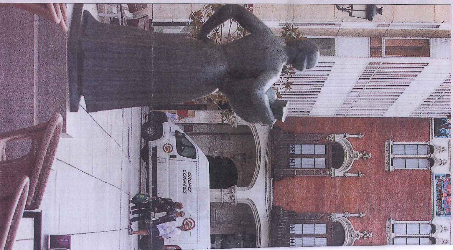
La circulación de vehículos por el centro peatonal estará controlada por videocámaras.

De todos los proyectos que componen los diferentes objetivos temáticos y las trece líneas de actuación, según pone de manifiesto el equipo de Gobierno, ya se han iniciado procesos para la contratación y posterior ejecución del concurso de ideas para la renovación de Los Jardillos (24.000); renovación del césped artificial del Sergio Asenjo (295.000); plan integral de transformación digital (60.500); plan de renovación de ordenadores (267.400); sustitución del pavimento del pabellón Campos Góticos (68.000); redacción del proyecto de rehabilitación del Puente de Hierro (8.160); adquisición de un servidor de copias de seguridad (2.345); redacción de la recuperación medioambiental río Carrión (17.860); rehabilitación de la fuente de San Juanillo (90.000);