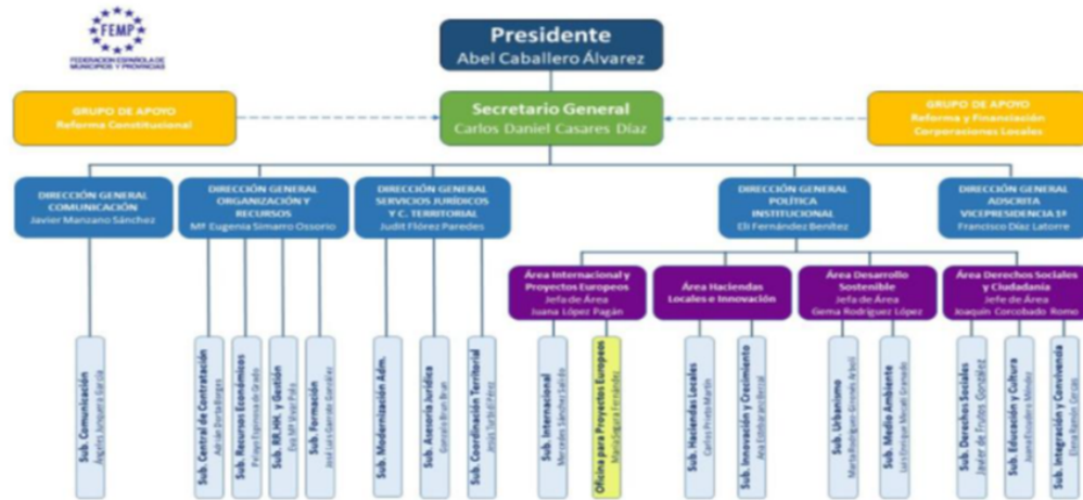
La estructura administrativa de la Federación está gestionada por la Secretaría General.

Con una plantilla de 116 personas en 2018 y retribuciones como las de su secretario general (90.000 euros) o su director general (75.000), así como con decenas de políticos en los órganos de dirección, constituye un núcleo de poder paralelo a los municipios, que desvía de la intervención municipal el control de parte del presupuesto municipal y desvincula la gestión de dinero público de la responsabilidad de la misma que los vecinos de cada municipio ha encargado a su alcalde y corporación. Se constituye en un entramado innecesario que duplica funciones, coloca amiguetes y burla la obligatoriedad de los procedimientos de control financiero de la administración pública, disfrazándose con simples auditorías de externos anuales preceptivas para el asociacionismo.