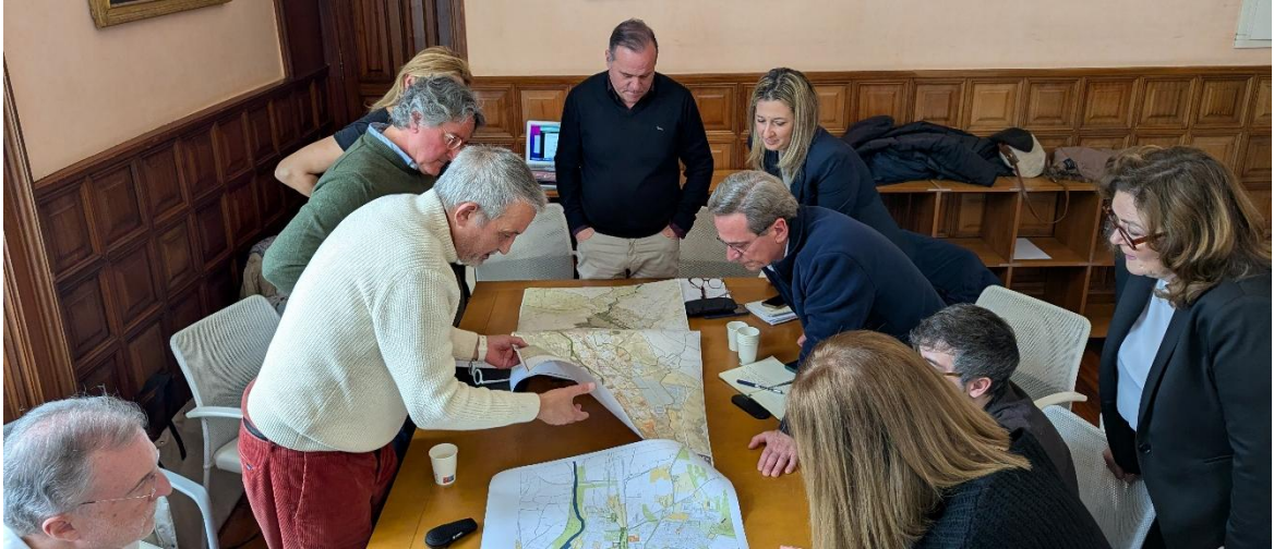
Reunión del Consejo de Seguimiento del Plan en marzo de 2026