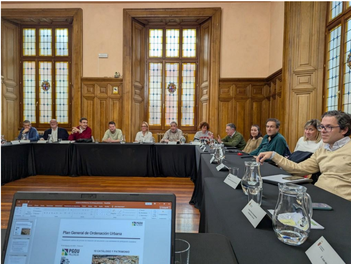
Reunión del Consejo Consultivo del Plan del 3 de marzo de 2026

Se ha abierto la web del plan en la dirección pgou.aytopalencia.es , en la cual se han incorporado páginas de información sobre el carácter del PGOU, la participación ciudadana, las fases de tramitación, y enlaces para descarga de elementos de información de utilidad para los ciudadanos. Esto permite que todo el mundo pueda acceder tanto a resúmenes de las reuniones mantenidas con el Consejo Consultivo como a las