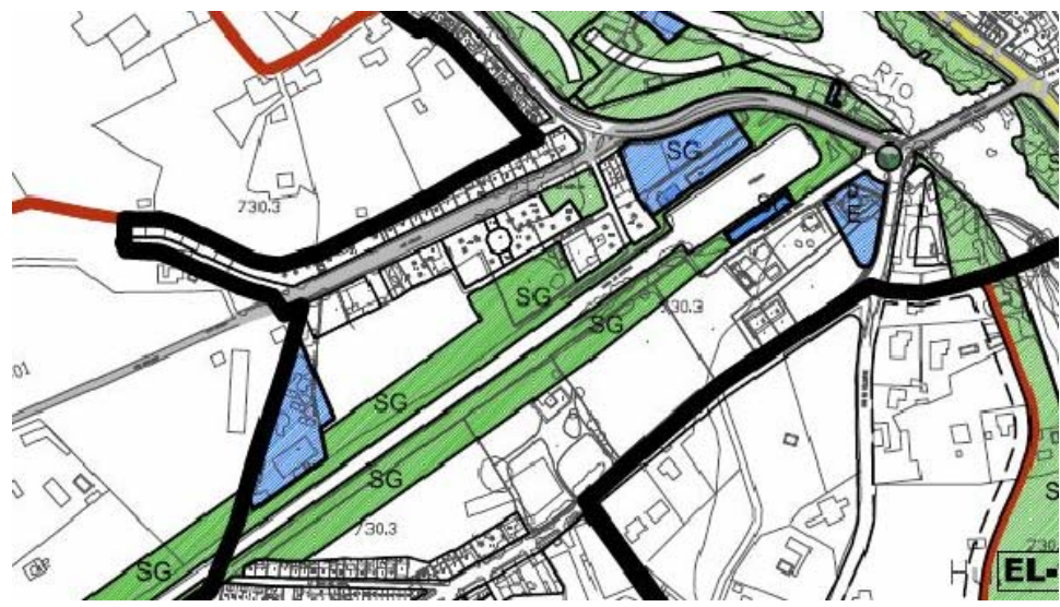
SISTEMAS GENERALES Y DOTACIONES LOCALES