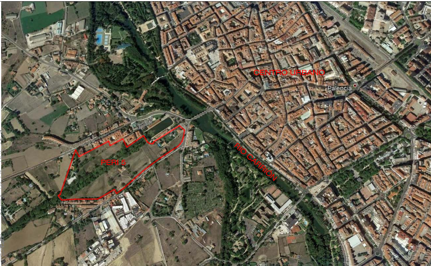
POSICIÓN respecto al centro urbano